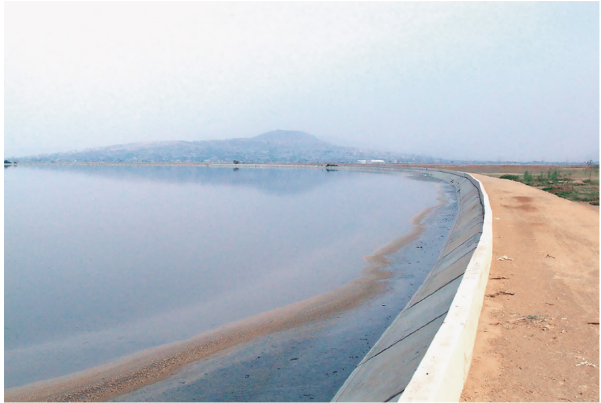
Figura 2. Lago Nabor Carrillo

1982. Tendría una capacidad de 30 millones de metros cúbicos de agua y con el paso del tiempo se convertiría en la obra emblemática del plan porque favoreció el retorno de aves migratorias procedentes de Norteamérica. 9 No deja de ser paradójica la cantidad de agua que se extrajo del acuífero para la construcción del lago Nabor Carrillo, ya que la técnica consistió en bombearla para provocar el hundimiento del suelo con un volumen de depresión aproximado a los 12 millones de metros cúbicos. “Para alcanzar estas cifras, fue necesario bombear en forma ininterrumpida, durante más de 5 años, un campo de 180 pozos de 60 metros de profundidad” (Comisión del Lago de Texcoco, 1983, p. 6). En varias estadísticas del agua se menciona recurrentemente que el acuífero de Texcoco se encuentra sobreexplotado; sería interesante averiguar si esta situación se agudizó a partir de la extracción acelerada de agua subterránea en esta etapa del PLT. Parece una hipótesis razonable a ser valorada por especialistas en la materia.