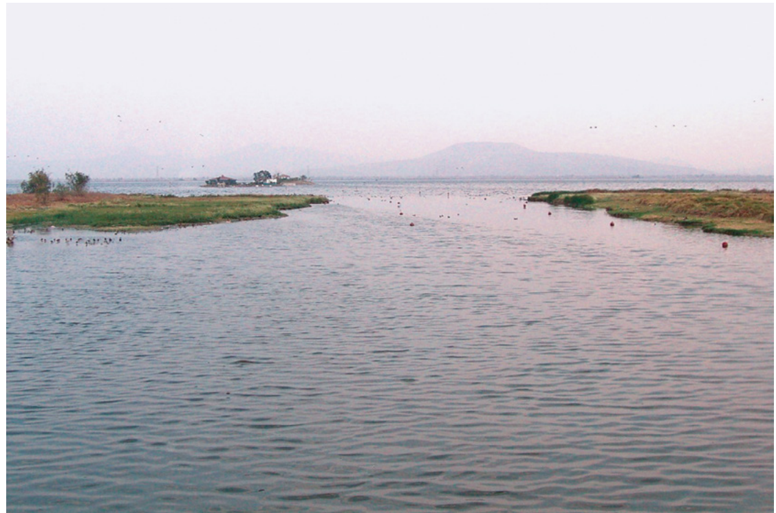
Figura 1. Lago de Texcoco

riesgo de inundaciones. También se realizaron algunas obras para permitir que las aguas de los ríos de la Piedad y Churubusco siguieran desaguando en el vaso de Texcoco. De alguna manera, esta función hidráulica fue clave para que la desecación no fuera total y se considerara importante tener una extensión de suelo libre de cualquier construcción o actividad ajena a la derivación de agua pluvial y fluvial. Conforme creció la Ciudad de México, esta derivación incluyó el desalojo combinado de estas aguas con las residuales que se desbordaban del Gran Canal.