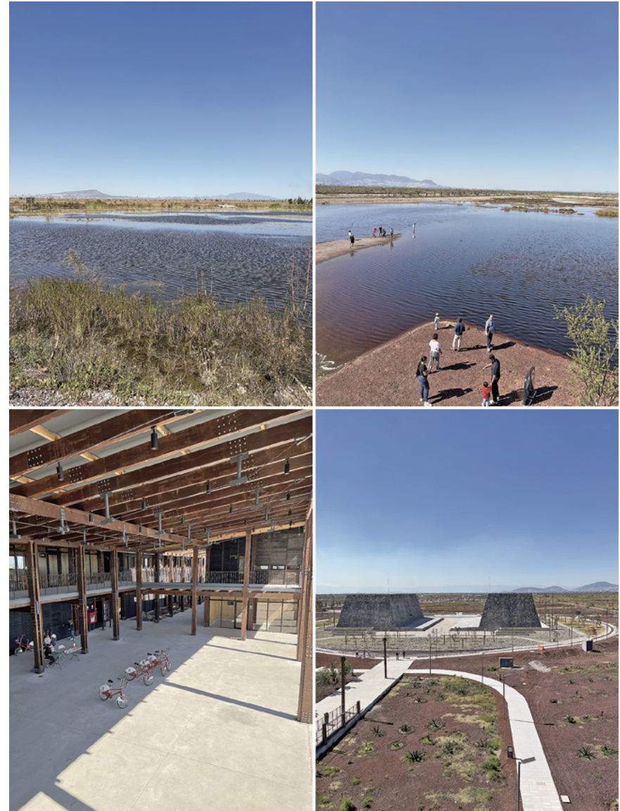
Figura 3. Parque Ecológico Lago de Texcoco